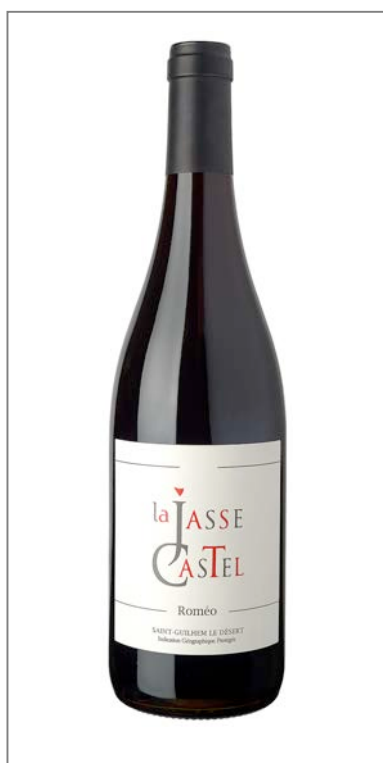
Roméo c'est le planteur du Carignan, C'est aussi toute une histoire...

Les parcelles sont situées dans le prolongement d'un des plus beaux villages de France.